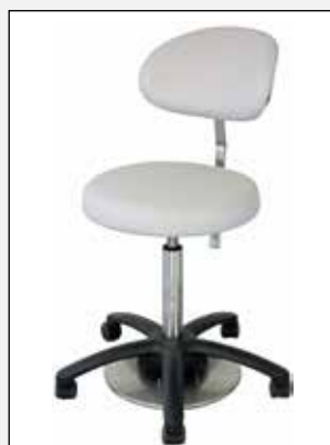
Rückenlehne Back rest