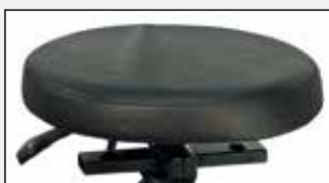
Runder Sitz Round seat