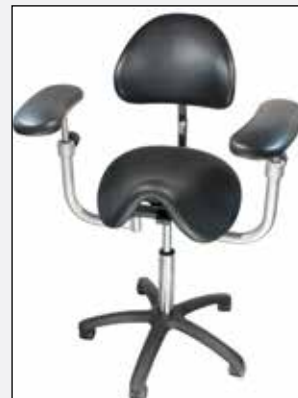
Standard Armlehnen Standard arm rests