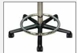
Fußring Foot rest