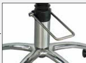
Fußpumpe Foot pump

Höhenverstellung, hydraulisch Height adjustment, hydraulic