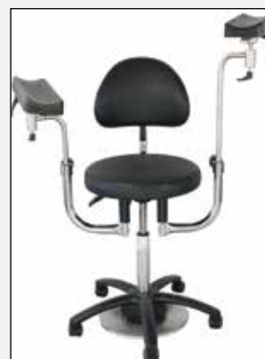
Mehrgelenks-Armlehne, kurz. oder verlängert Multi articulated arm rest, short. or extended