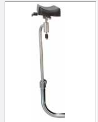
Verlängerte Armlehnen Extended arm rests