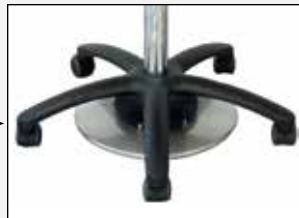
Fußauslösung Foot release

Höhenverstellung, pneumatisch Height adjustment, pneumatic