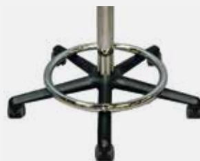
Fußring Foot rest