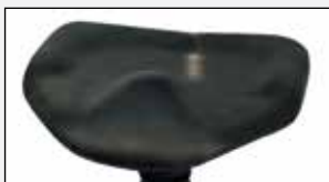
Anatomischer Sitz Anatomical shaped seat