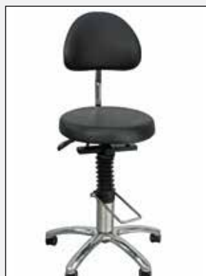
Rückenlehne Back rest