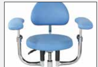
Standard Armlehne Standard arm rest