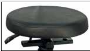
Runder Sitz Round seat