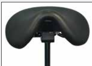
Sattelsitz Saddle seat