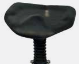
Anatomisches Sitzpolster Anatomical seat cushion