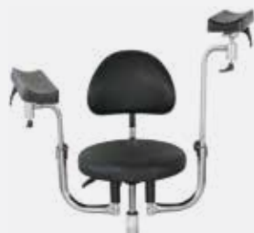
Kurze / lange Armstützen Short / extended arm rests