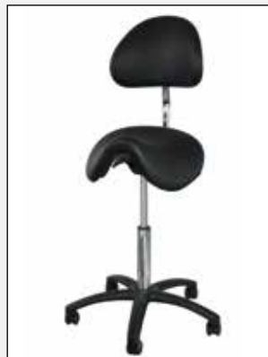
Rückenlehne Back rest