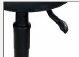
Handauslösung Hand release