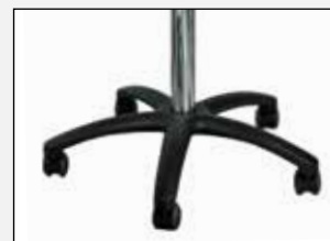
Ohne Fußring No foot rest